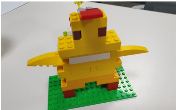
④ Step 2. 개인 모델 만들기