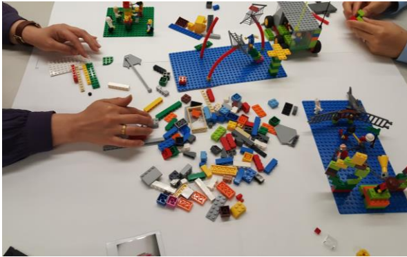
① 레고와 친해지는 시간, 스킬스 빌딩