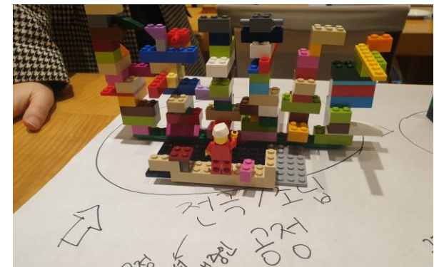
⑥ 함께 레고 Rebuild 통해 생각확장하기