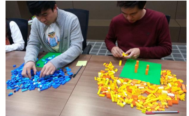
③ Step1. 도전과제 설정 및 만들기