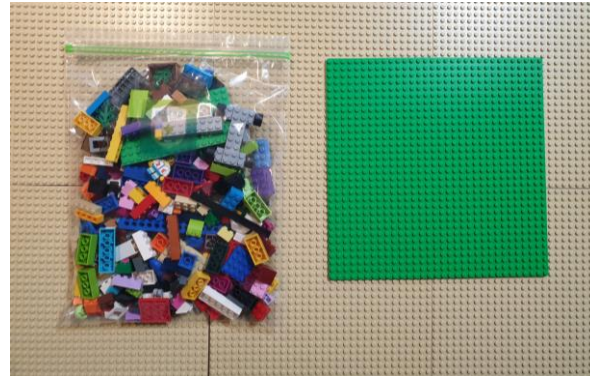
② 교육용 레고 키트 제공