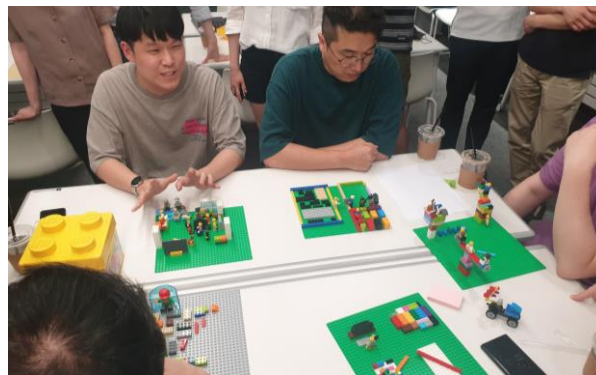
⑤ Step 3. 개인모델 공유하기 및 생각정리